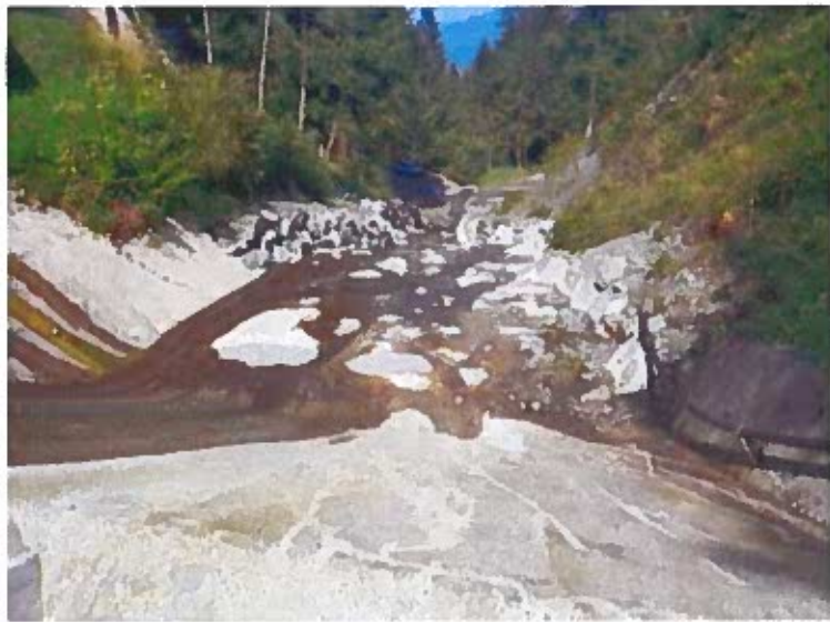
Radier Béton et enrochement construit en 2022