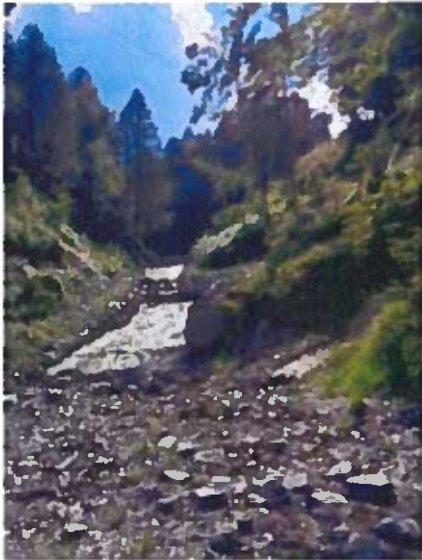
Radier Béton et enrochement construit en 2022