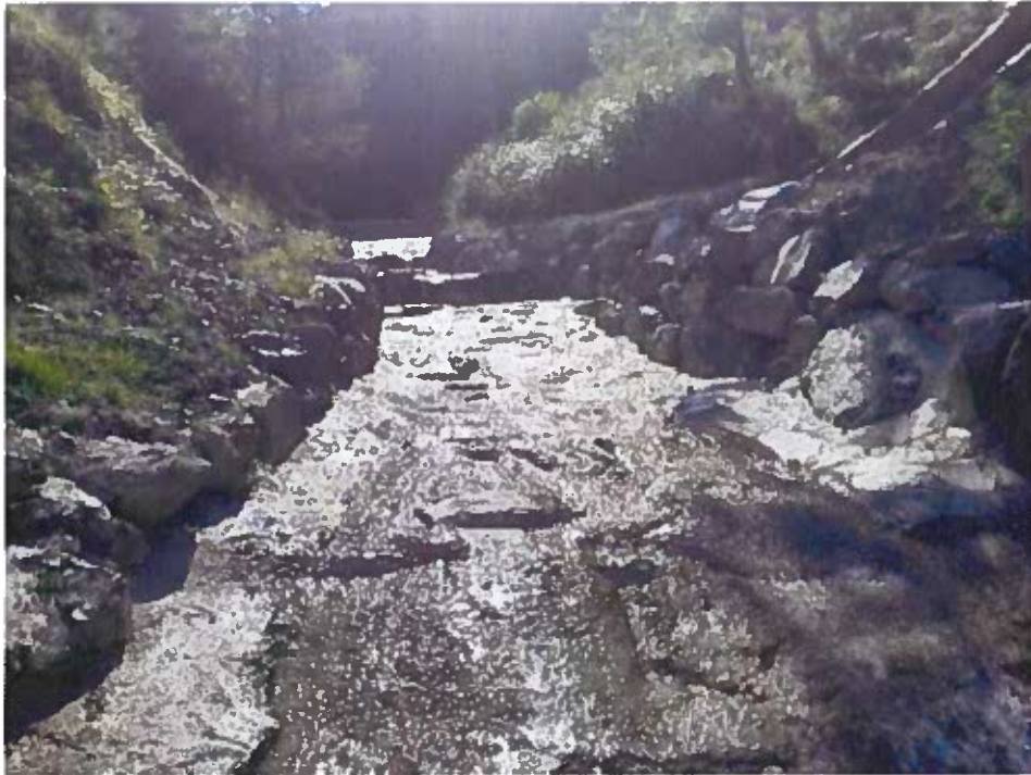
Radier Béton et enrochement construit en 2022